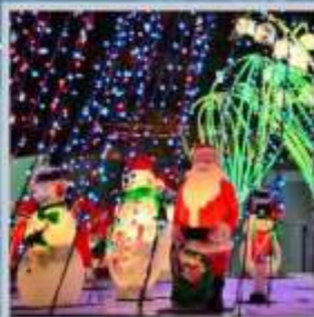
"ODORI GERMAN CHRISTMAS"