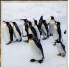
“PENGUIN ASAHİYAMA ZOO”