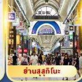
ย่านสุซึกิโนะ