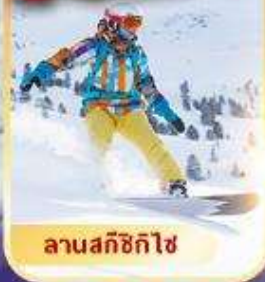
ลานสกีซิกิไซ