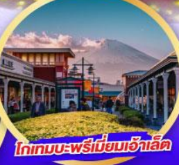
โทกามะ-พรีเมียมเฮ้าส์