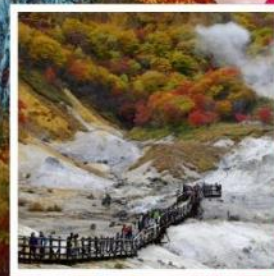
หุบเขานรก จิโคะคุดาบิ