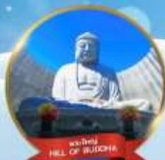
พระใหญ่ HILL OF BUDDHA

พักโทมามุสกีรีสอร์ท 1 คืน • อาฮาชิคาว่า 1 คืน