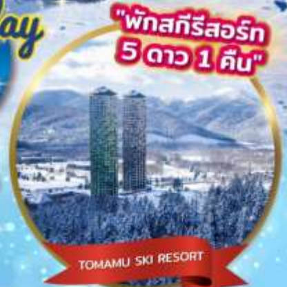
TOMAMU SKI RESORT