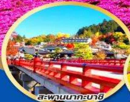
สะพานนากะบาชิ