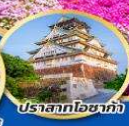
ปราสาทโอซาก้า