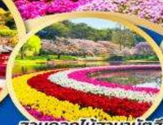
สวนดอกไม้ฮามามัตสึ