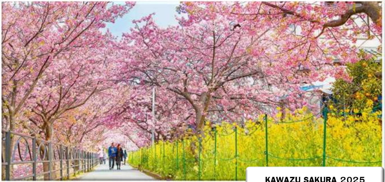
KAWAZU SAKURA 2025

คาวาซุ ซากุระ เฟสติวัล (Kawazu Sakura Festival) โดยมักจัดช่วงต้นเดือนกุมภาพันธ์ – ต้นเดือนมีนาคม ของทุกปี ซึ่งได้รับความสนใจอย่างมาก มีผู้เข้าชมมากถึง 1 ล้านคน จุดเด่นของดอกซากุระของที่นี่คือดอกมีสีชมพู และมีขนาดใหญ่พิเศษ ที่นี่มีซากุระมากถึง 8,000 ต้น