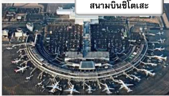
สนามบินชิโตเสะ

เวลา 23.45 น. ออกเดินทางสู่ สนามบินชิโตเสะ ฮอกไกโด ประเทศญี่ปุ่น โดยสายการบินไทย เที่ยวบินที่ TG 670