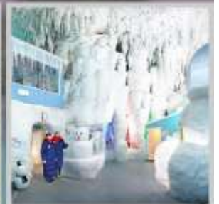
"KAMIKAWA ICE PAVILLION"