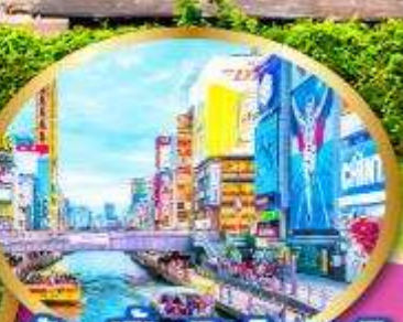
ช้อปปิ้งชินไซบาชิ