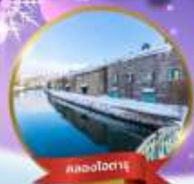
ตลาดปลาเมือ

พักโทมามุสกีรีสอร์ท 2 คืน ฮาชิคาวา 1 คืน ซังโปโร (สวนหิมะ) 2 คืน