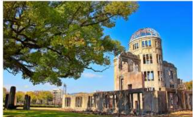
รับประทานอาหารกลางวัน ณ กัดตาคาร