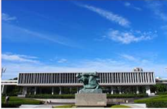
HIROSHIMA PEACE MEMORIAL MUSEUM

"พิพิธภัณฑ์สันติภาพฮิโรชิมา" ถูกสร้างขึ้นเพื่อเป็นอนุสรณ์และรำลึกถึงเหตุการณ์ระเบิดปรมาณูที่เกิดขึ้นในวันที่ 6 สิงหาคม พ.ศ. 2488 พิพิธภัณฑ์แห่งนี้เปรียบเสมือนห้องเรียนขนาดใหญ่ที่รวบรวมเรื่องราวและหลักฐานทางประวัติศาสตร์ที่น่าสะท้อใจของเหตุการณ์ระเบิดปรมาณู ผ่านภาพถ่าย วัตถุโบราณ และคำบอกเล่าของผู้รอดชีวิต