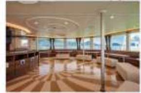
รับประทานอาหารกลางวัน ณ กิคุคาคุวาระ