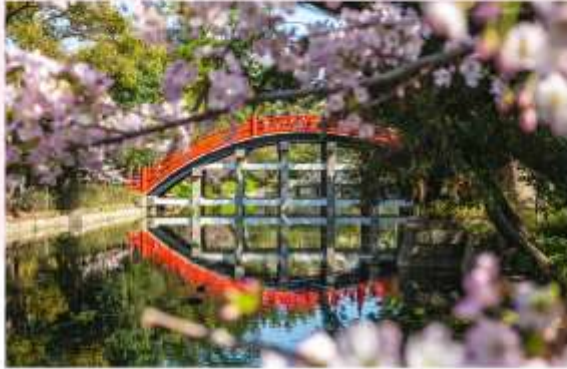
SUMIYOSHI TAISHA SHRINE