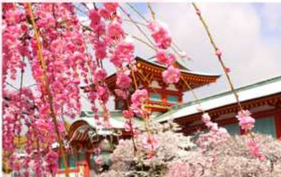
HOFU TENMANGU SHRINE