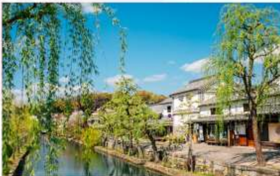
KURASHIKI BIKAN HISTORICAL QUARTER

"ศูนย์ประวัติศาสตร์ คุราชิกิ บิกัง" ย่านเมืองเก่าที่งดงามริมคลองในเมืองคุราชิกิ มีเอกลักษณ์โดดเด่นด้วยอาคารโกดังสีขาวริมคลองบรรยากาศเย็นสงบ และความหลากหลายทางวัฒนธรรมที่ผสมผสานระหว่างญี่ปุ่นและตะวันตกได้อย่างลงตัว