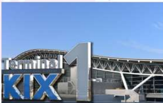
KANSAI INTERNATIONAL AIRPORT