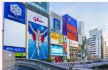
SHOPPING AT SHINSAIBASHI