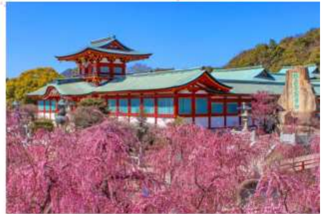
HOFU TENMANGU SHRINE