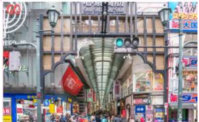
อิสระอาหารกลางวันตามอัธยาศัย (ไม่รวมในรายการ)