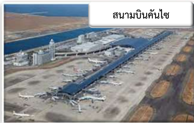
สนามบินคันไซ

เวลา 15.55 น. เดินทางถึง สนามบินคันไซ ประเทศญี่ปุ่น นำท่านผ่านขั้นตอนการตรวจคนเข้าเมืองและศุลกากร