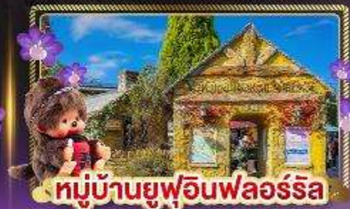
หมู่บ้านยูฟูอินฟลอร์ริล