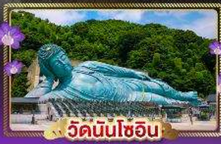
วัดนินโซอิน