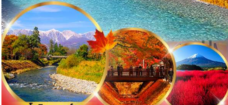
โออิตะ พาร์ค