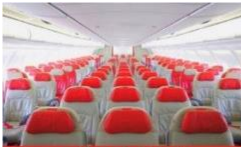
เครื่องลำใหญ่ 377 ที่นั่ง