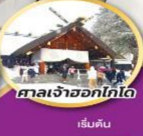
ศาลเจ้าออกโกโด