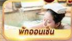
พักออนเซ็น