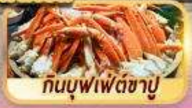
กินบุฟเฟ่ต์ซาปู