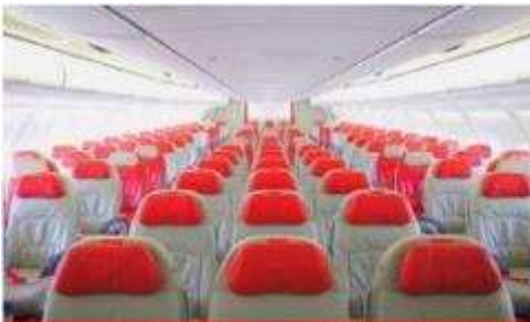
เครื่องลำใหญ่ 377 ที่นั่ง