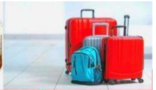
น้ำหนักกระเป๋า สูงสุด 20 กก.