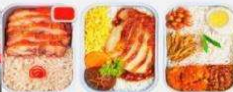
บริการอาหารร้อน ทั้งขาไป-ขากลับ