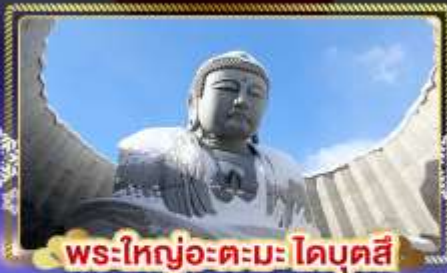
พระใหญ่อะตะมะโดบุตสึ