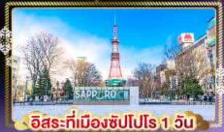
อิสระที่เมืองซัปโปโร 1 วัน