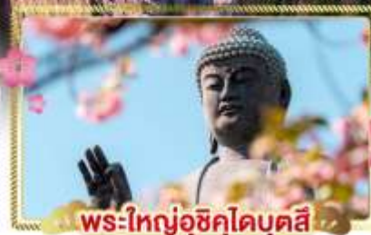
พระใหญ่อุซึคุโอบุคซึ