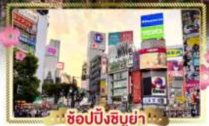
ช้อปปิ้งชิบูย่า