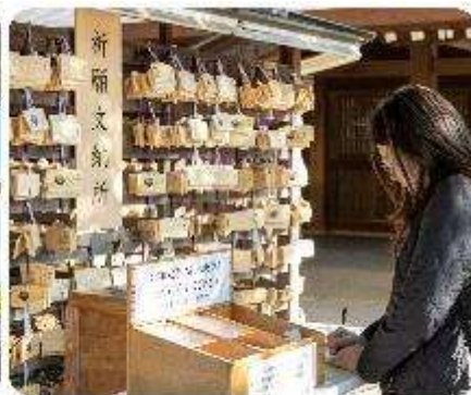
ศาลเจ้าเมจิจิงกู

ศาลเจ้าเมจิ หนึ่งในสถานที่อันศักดิ์สิทธิ์ใจกลางกรุงโตเกียว สิ่งแรกที่จะทำให้คุณประทับใจคือการเดินผ่านเสาโทริอิขนาดใหญ่ ระหว่างทางมีธรรมชาติที่ทำให้รู้สึกเหมือนก้าวเข้าสู่อีกโลกหนึ่ง ที่เต็มไปด้วยความสงบ อีกทั้งยังสามารถเขียนคำอธิษฐานลงบนแผ่นไม้ "เอมะ" เพื่อขอพรสำหรับความสุขและความสำเร็จในชีวิตอีกด้วย จากนั้นนำพาทุกท่าน... ซุปปังกันต่อใจกลางกรุงโตเกียว เมืองที่เป็นศูนย์กลางของแฟชั่นและนวัตกรรม และเปิดประสบการณ์การซูปปังที่ไม่เหมือนใคร! สักรวดย่านต่าง ๆ ที่แต่ละแห่งที่มีเสน่ห์และเอกลักษณ์อันโดดเด่น เมืองที่เต็มไปด้วยชีวิตชีวาและความทันสมัยที่หลากหลายอย่าง ย่านฮาราจุกุ แหล่งรวมแฟชั่นที่แปลกใหม่และสดใส เดินเล่นบน Takeshita Street ที่เต็มไปด้วยเสื้อผ้าและเครื่องประดับที่ไม่ซ้ำใคร เพลิดเพลินกับบรรยากาศสุดคูลที่เป็นเอกลักษณ์