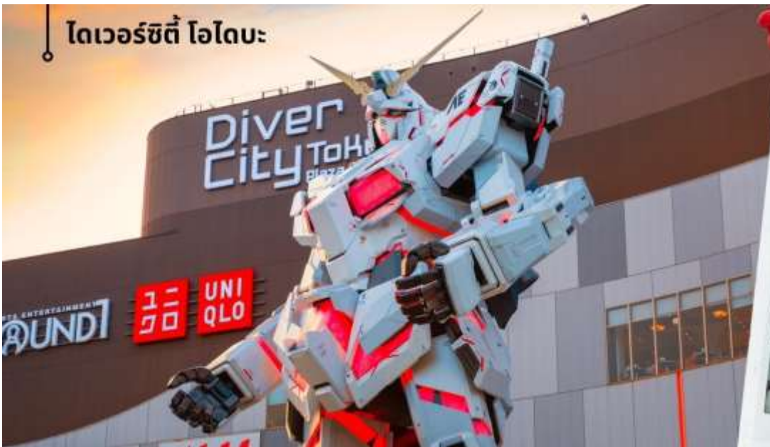
ไทเวอร์ซิตี โอโดะ

จากนั้นนำท่านสู่ ไทเวอร์ซิตี โอโดะ Diver City Plaza เป็นเกาะจำลองขนาดใหญ่ ซึ่งสร้างขึ้นจากการถมทะเลบริเวณอ่าวโตเกียว เดิมโตขึ้นอย่างรวดเร็วในฐานะเขตท่าเรือจนถึงช่วงทศวรรษที่ 1990 โอโดะ ได้กลายเป็นย่านการค้ามี ห้างสรรพสินค้าขนาดใหญ่ที่ปักอาศัยและแหล่งบันเทิงที่ใหญ่โตแห่งหนึ่งให้ท่านได้ชม Unicorn Gundam หุ่นกันดั้มตัวใหม่เป็นรุ่น RX-0 Unicorn Gundam ในโหมด Destroy เป็น หุ่นสีขาว-แดงมีความสูงประมาณ 24 เมตร สูงกว่าหุ่นตัวเดิมถึง 6 เมตร และซอปปิงตามอัธยาศัย