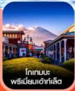
โกเทมมะ พรีเมียมเอ้าท์เล็ต