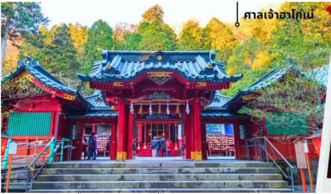
ศาลเจ้าอาโถม