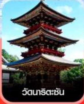
วัดเทริเดะซัน