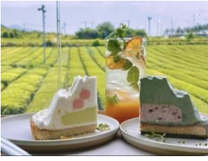
ยิ่งใหญ่อลังการของไรชาที่นี่

พาท่านเดินทางสู่ ไรชาเขียวโอซุลลอค ขึ้นชื่อที่สุดแห่งเกาะเชจู O'Sulloc ซึ่งจะแบ่งเป็นโซนไรชากลางแจ้ง และโซนพิพิธภัณฑ์ที่มีการจัดแสดงเรื่องราวของชา ร้านคาเฟ่ และร้านขายของฝาก ซึ่งท่านสามารถเยี่ยมชมได้ทุกโซน เกาะเชจูเป็นดินแดนที่ได้รับของขวัญจากธรรมชาติ ปลูกชาเขียวได้คุณภาพสูง ผสมผสานกับนวัตกรรมสมัยใหม่ จนทำให้ชาที่นี่ส่งออกไปขายทั่วโลก นักท่องเที่ยวทั้งเกาหลีและต่างชาติมักมีจุดมุ่งหมายที่จะมาลิ้มรสความอร่อยของชาที่มีรสชาติเป็นเอกลักษณ์ถึงแหล่งผลิต โดยเฉพาะไอศกรีมชาเขียว เค้กโรล เครื่องดื่มชาเขียวทั้งร้อนและเย็น รับประกันความฟินไปตามๆกัน ส่วนใครที่เน้นการชมวิวถ่ายรูป สวยทุกมุมจนกดชัตเตอร์รัวๆแน่นอน ไม่ว่าจะเป็นโซนไรชา หรือขึ้นไปจุดชมวิวด้านบนสุดของพิพิธภัณฑ์ ก็จะเป็นความ