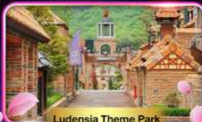
Ludensia Theme Park