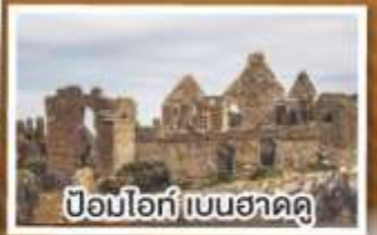
ป้อมโอ๊ก เบนฮาดู