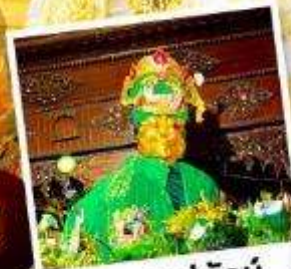
ขอฟรแม่ย์กั๋