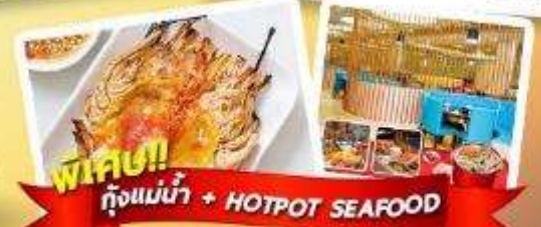
พิเศษ!! กั๋งแม่น้ำ + HOTPOT SEAFOOD