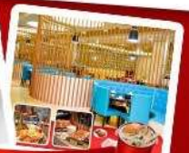
กึ่งแม่น้ำ + HOTPOT SEAFOOD