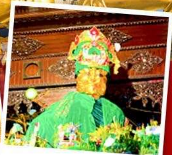
ขอพรแม่ยักษ์