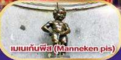
แมนเกนพีส (Manneken pis)