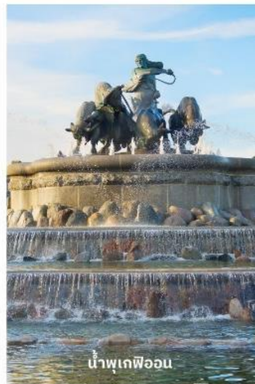
น้ำพุเกฟิออน