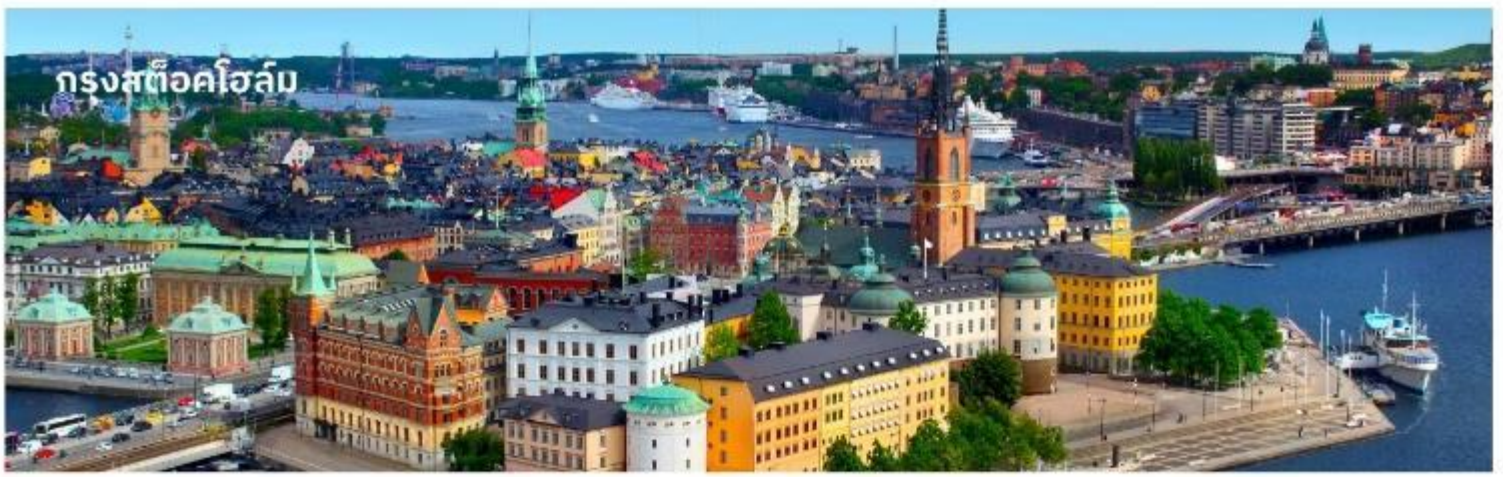
กรุงสต็อกโฮล์ม

จากนั้นนำท่านเข้าชม พิพิธภัณฑ์เรือวาซา ซึ่งตั้งโชว์เรือรบโบราณที่กู้ขึ้นมาได้จากที่ใต้ทะเลและยังคงสภาพที่สมบูรณ์ จัดเป็นพิพิธภัณฑ์ที่มีชื่อเสียงที่สุดแห่งหนึ่งในสต็อกโฮล์ม เรือวาซานั้นสร้างขึ้นเมื่อปี ค.ศ.1628 เพื่อให้เป็นเรือรบที่ใหญ่ที่สุด โดยบรรจุปืนใหญ่ถึง 64 กระบอก แต่เพียงวันแรกที่ออกเดินทางได้ประมาณ 500 เมตร เรือก็จมลงสู่ใต้ทะเลลึก 35 เมตร และในศตวรรษที่ 20