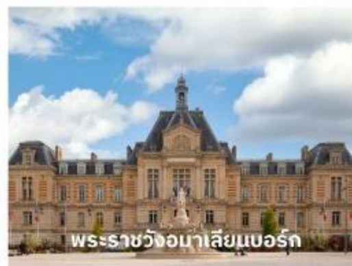
พระราชวังอมาเลียนบอร์ก