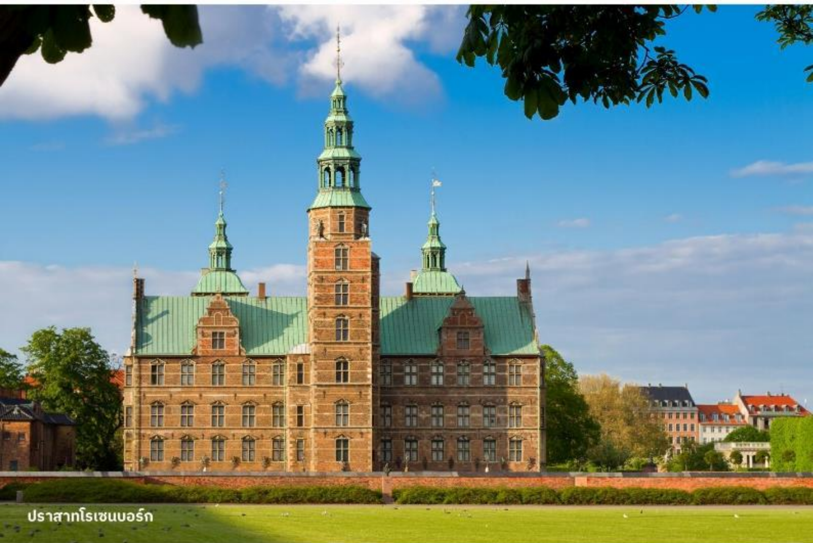
ปราสาทโรเซนบอร์ก

จากนั้นนำท่านเข้าชม ปราสาทโรเซนบอร์ก พระราชวังฤดูร้อนใจกลางเมืองโคเปนเฮเก้น เป็นพระราชวังที่มีอายุเก่าแก่กว่า 400 ปี โดยสถาปัตยกรรมของพระราชวังโรเซนเบิร์กนั้นได้รับอิทธิพลมาจากสถาปัตยกรรมรูปแบบเรอเนสซองส์ ซึ่งไฮไลท์สำคัญในการเข้าชมคือการชมเครื่องราชกกุธภัณฑ์ (The Crown Jewels) ของราชวงศ์เดนมาร์ก ซึ่งเป็นสมบัติล้ำค่าที่สุดที่จัดแสดงอยู่ที่นี่