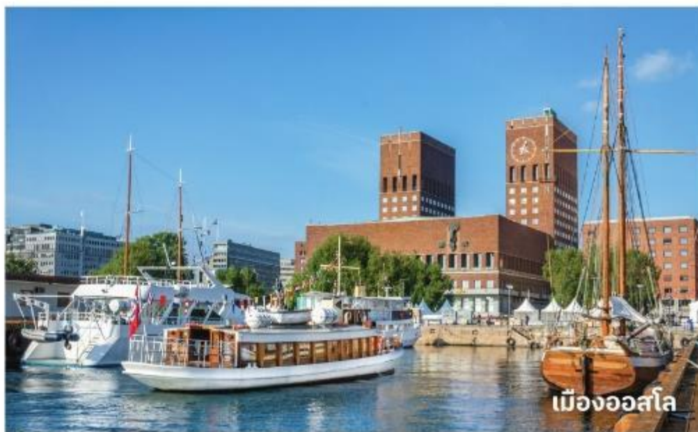
เมืองออสโล