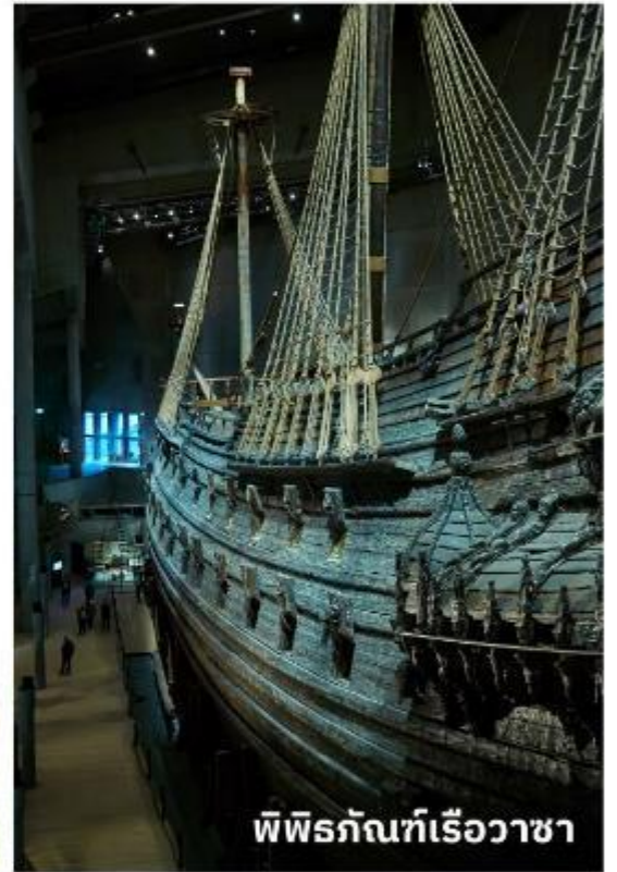
พิพิธภัณฑ์เรือวาซา

เรือลำนี้ได้ถูกยกขึ้นมาจากใต้ทะเลโดยใช้เทคนิคพิเศษที่มีความทันสมัย และได้นำเรือวาซาลำดังกล่าวมาจัดแสดงเป็นพิพิธภัณฑ์ ทุกท่านจะได้พบกับเรือ Vasa ขนาดใหญ่ และจะได้ชมโครงสร้างของเรือ, ประวัติของการสร้างและสถานการณ์ที่ทำให้เรือล่มรวมถึงเรียนรู้เรื่องราวต่างๆ ที่เกี่ยวข้องกับ Vasa ได้อย่างลึกซึ้ง