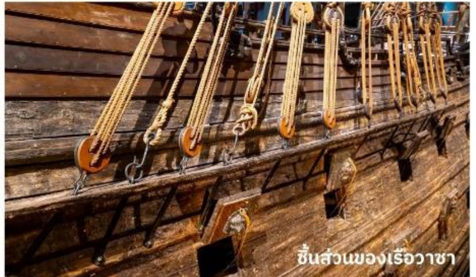
ชิ้นส่วนของเรือวาซา