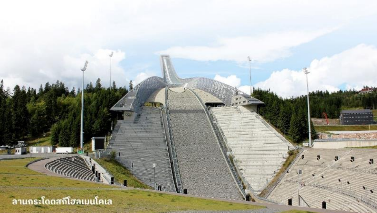
ลานกระโดดสกีโฮลเมนโคเลน

จากนั้นนำท่านเดินทางสู่ ลานกระโดดสกีโฮลเมนโคเลน (Holmenkollen Jump Ski Arena) ตั้งอยู่ในเมืองออสโล ประเทศนอร์เวย์ เป็นหนึ่งในสถานที่ที่มีชื่อเสียงในวงการสกีกระโดด มีประวัติ ยาวนานและเป็นที่รู้จักอย่างกว้างขวางในการแข่งขันสกีกระโดดและการแข่งขันกีฬาฤดูหนาวอื่นๆ นอกจากนี้ยังมีพิพิธภัณฑ์เกี่ยวกับกีฬาและศูนย์ข้อมูลเกี่ยวกับประวัติศาสตร์ของการสกีกระโดดให้ผู้ เยี่ยมชมได้ศึกษาด้วย