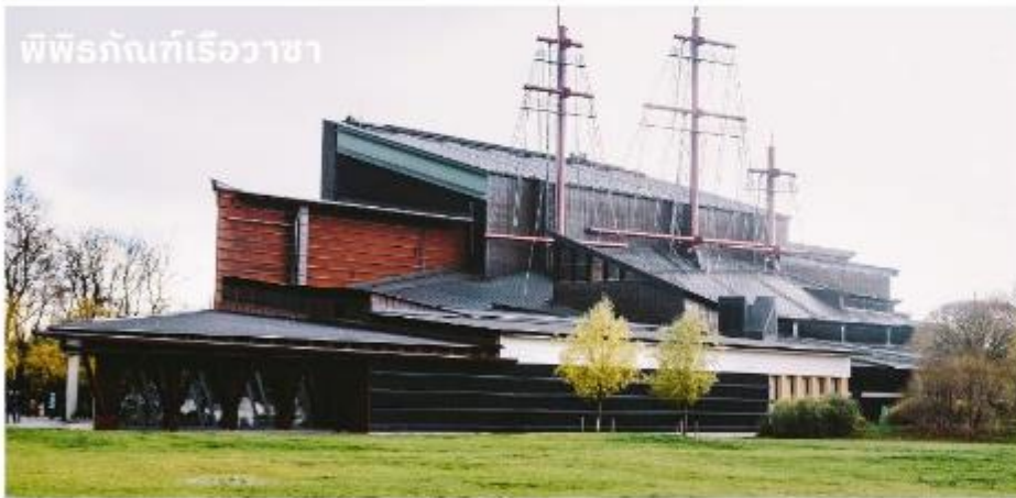
พิพิธภัณฑ์เรือวาซา