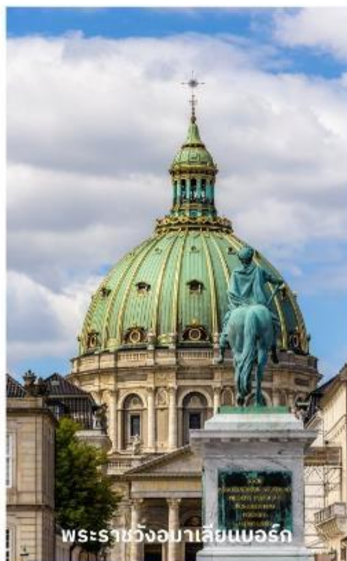
พระราชวังอมาเลียนบอร์ก