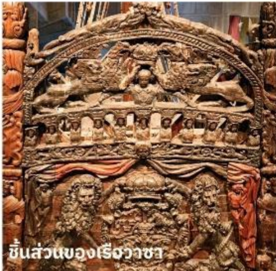
ชิ้นส่วนของเรือวาซา