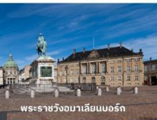
พระราชวังอมาเลียนบอร์ก