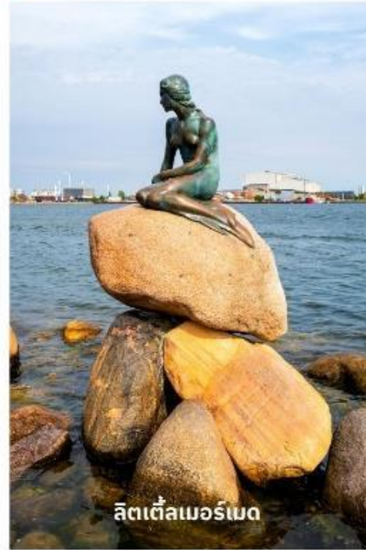
ลิตเติ้ลเมอร์เมด