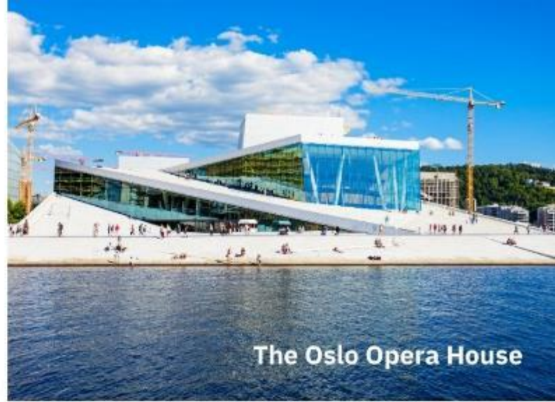
The Oslo Opera House

นำท่านเข้าสู่ที่พัก Scandic Helsfyr หรือเทียบเท่า