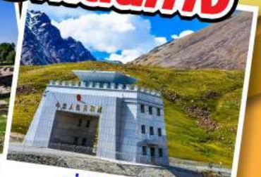
ด่านคุนจิรา