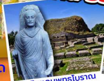
ดินแดนพุทธโบราณ ตักศิลา