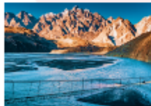
สะพานแขวนอุสโซนิ