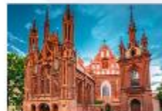
โบสถ์เซนต์แอน