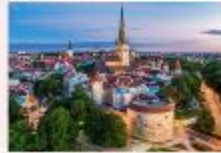
Tallinn Old Town