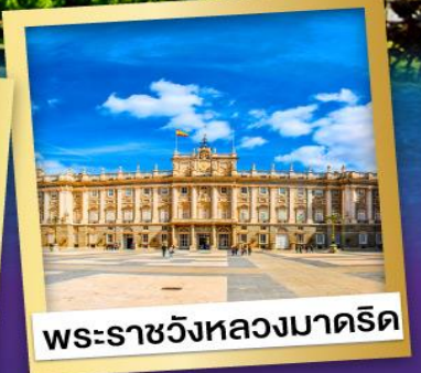
พระราชวังหลวงมาดริด