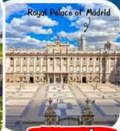
Royal Palace of Madrid