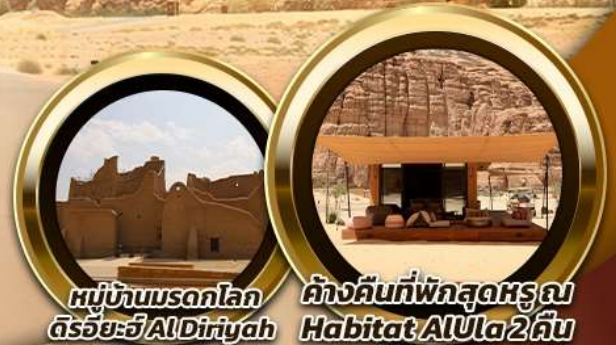
หมู่บ้านมรดกโลก ดีริยยะฮ์ AlDiriyah

บินหรู อยู่สบาย เที่ยวชิลด์ ชิลด์ 10 ท่าน คอนเฟิร์มเดินทาง