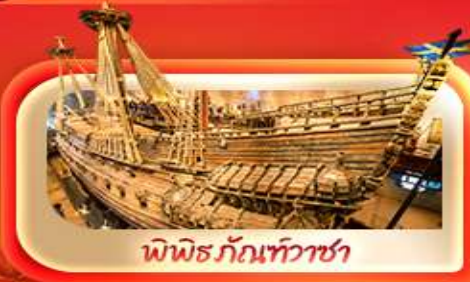
พิพิธภัณฑ์ท้าวชา