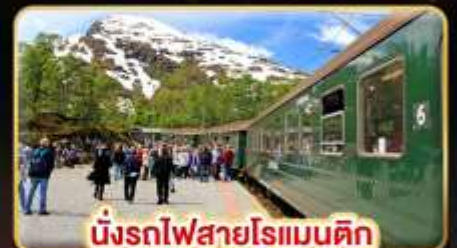
นั่งรถไฟสายโรแมนติก “ฟรอมสปานา”