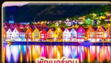
พักเบอร์เกน