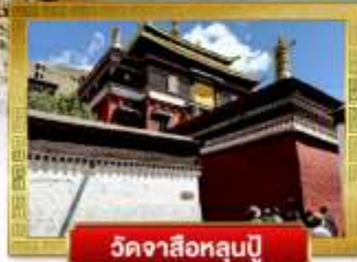
วัดจาซือหลุนปู