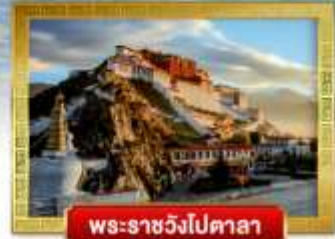
พระราชวังโปตาลา