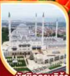
มัสยิดคามลิกา