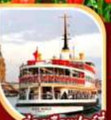
ล่องเรือเฟอร์รี่