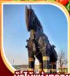
ม้าไม้แห่งทรอย