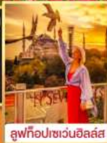
ลู่ฟือปเซเวนฮิลล์ส