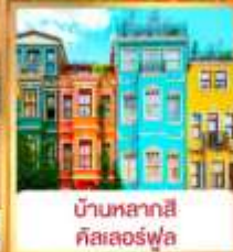
บ้านหลากสี คิสเลอร์ฟูล