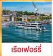
เรือเฟอร์รี่

เที่ยวครบเส้นทางยอดนิยม บินเข้าถึงเย็น เช้าชมสุเหร่ายักษ์คามลิก้า และล่องเรือเฟอร์รี่ ชมเทศกาลทิวลิปแห่งนครอิสตันบูล