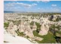
หุบเขาเดเฟเรนท์

** พักที่ Dedeli Cave Hotel 5* หรือเทียบเท่า **