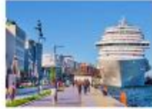
ล่องเรือช่องแคบบอสฟอรัส Galata Port

** พักที่ Crowne Plaza Istanbul - Harbiye 5* หรือเทียบเท่า **