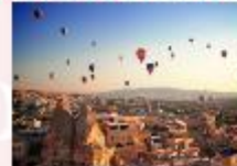
เมืองคัปปาโดเกีย