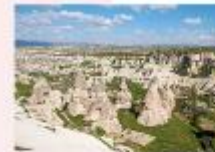
หุบเขาเทพเรนท์

** พักที่ Dedeli Cave Hotel 5* หรือเทียบเท่า **