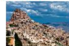
เมืองอุซซาร์