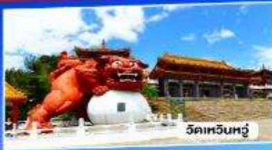
วัดเหยี่ยวหัว

อาลีซาน ทะเลสาบสุริยันจันทรา จั๋วเฟิ่น 5วัน 3คืน