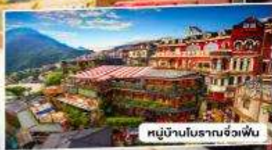
หมู่บ้านโบราณจั๋วเฟิ่น