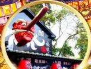
หมู่บ้านปิตาจชโก