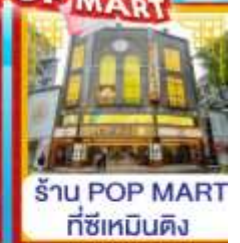
ร้าน POP MART ที่ซีเหมินติง