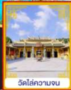
วัดไล่ความจน