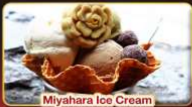
Miyahara Ice Cream