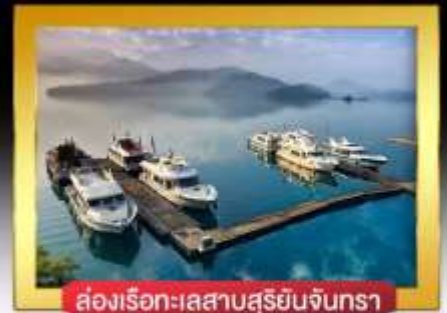
ส่องเรือทะเลสาบสุริยันจันทรา