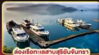
ล่องเรือทะเลสาบซูริยิมจินตรา