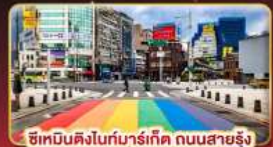
ช้อปปิ้งในท่ามาร์ทเกิด ถนนสายรัง