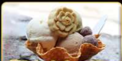
ฟรี Miyahara Ice Cream 1 Scoop

"ขอความรักวัดหลงซาน" ปล่อยโคมลอยเส้นทางรถไฟผิงซี