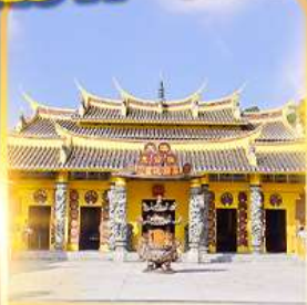
วัดชอพรเทพเจ้า