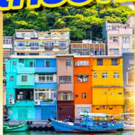
หมู่บ้านประมงเจินปิง

พักชิเหมินตง 2 คืน เที่ยวเต็ม!! ไม่มีวันอิสระ